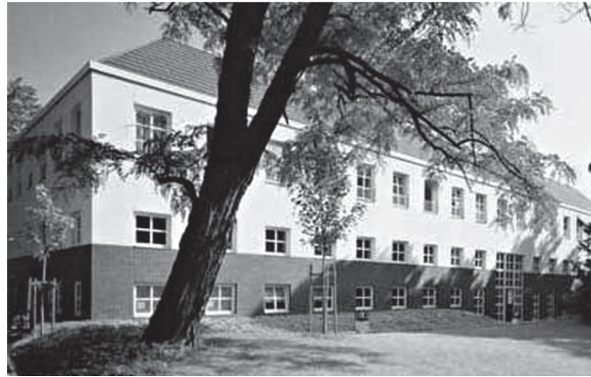
Universitätsclub Bonn, Konviktstraße 9, 53113 Bonn.